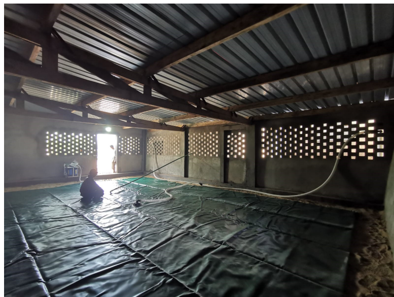
Intérieur d'un abri de citerne avant son remplissage.

Un an après avoir quitté l'usine Citerne d'Amboise, les citernes d'eau sont installées dans les deux centres AFFD de Fianarantsoa.